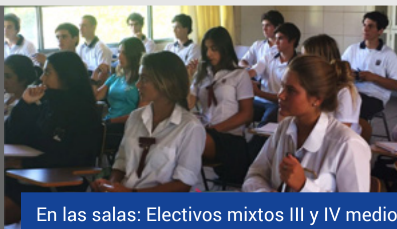
En las salas: Electivos mixtos III y IV medio

Ref. N° 28, Ideario de los colegios del Regnum Christi.