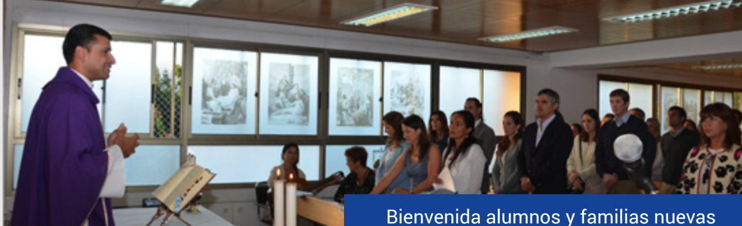
Bienvenida alumnos y familias nuevas